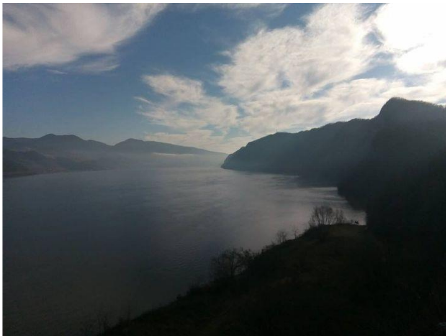
Alasi Tekijanci

Ispod brda strmoglava Teče reka, modro plava, Alasima rodna njiva, a obale pune šljiva. Priča ona svoju priču,