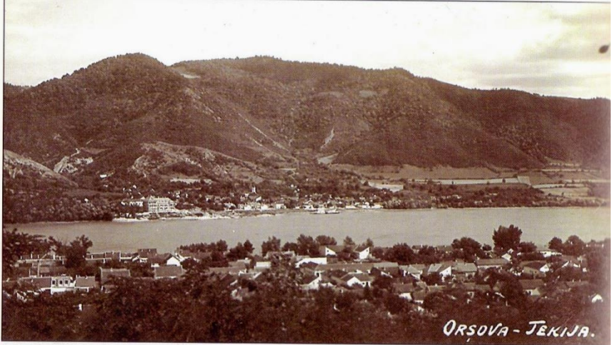
Оршава – Текија